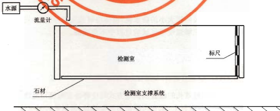
图 1 测试示意图